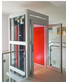
komplett home lift acélszerkezetű aknával