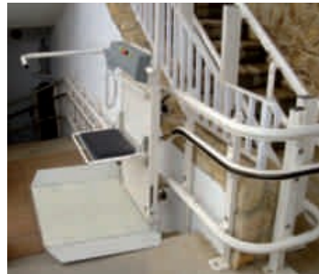
Emelőplatós lépcsőjáró berendezés