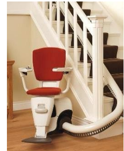
Ülőszékes lépcsőjáró berendezés